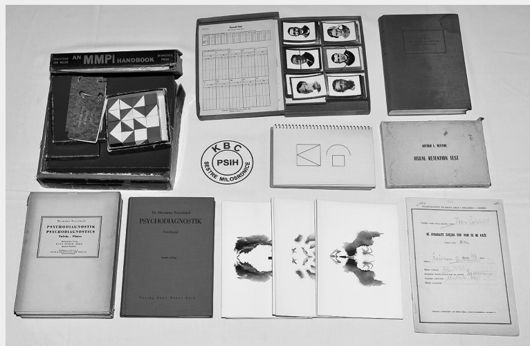
Slika 6. Testovi Jelene Turdiu