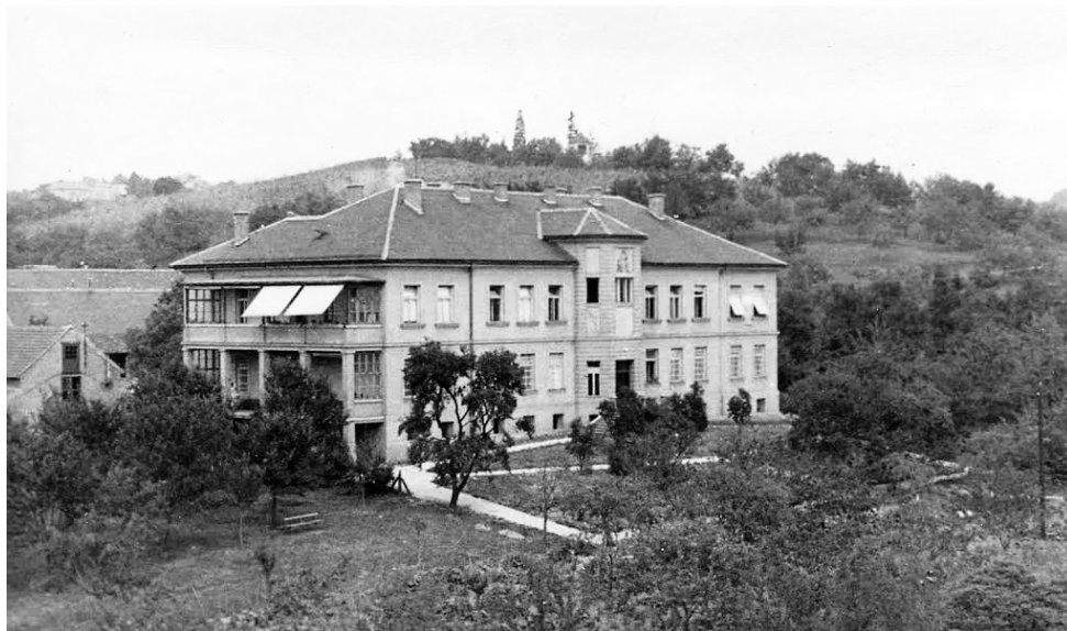
Slika 3. Bolnica Sestara milosrdnica - zgrada u kojoj je smješten Odjel za neurologiju i psihijatriju od 1948. godine.

Redoviti kliničko-psihološki rad započinje u Bolnici sestara milosrdnica. “Prvi ispitanik u našoj kliničkoj psihologiji bila je djevojčica koju dovodi majka s ciljem procjene oligofrenije i procjene može li pohađati školu. Rezultati testiranja pokazali su da je riječ o natprosječno inteligentnoj djevojčici, što je kasnije pokazao i njezin školski uspjeh.” (Turdiu-Šimunec, 1970).